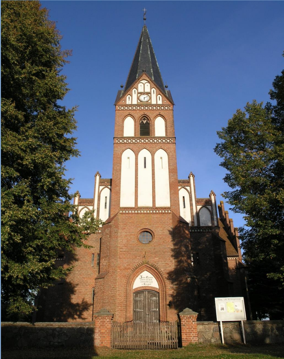
Kirche zu Leussow

der Evangelisch – Lutherischen Kirchengemeinde Leussow-Redefin